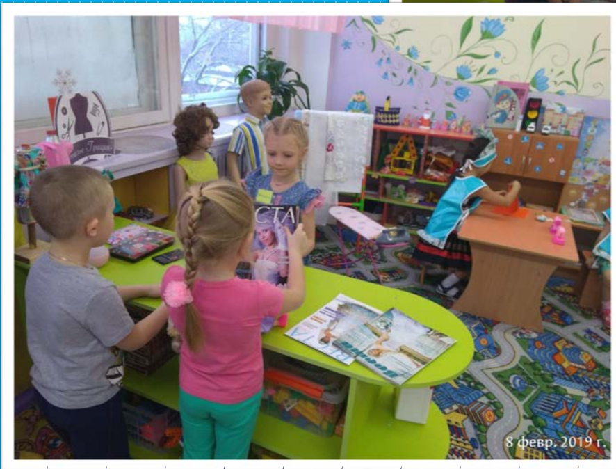
8 февр. 2019 г.