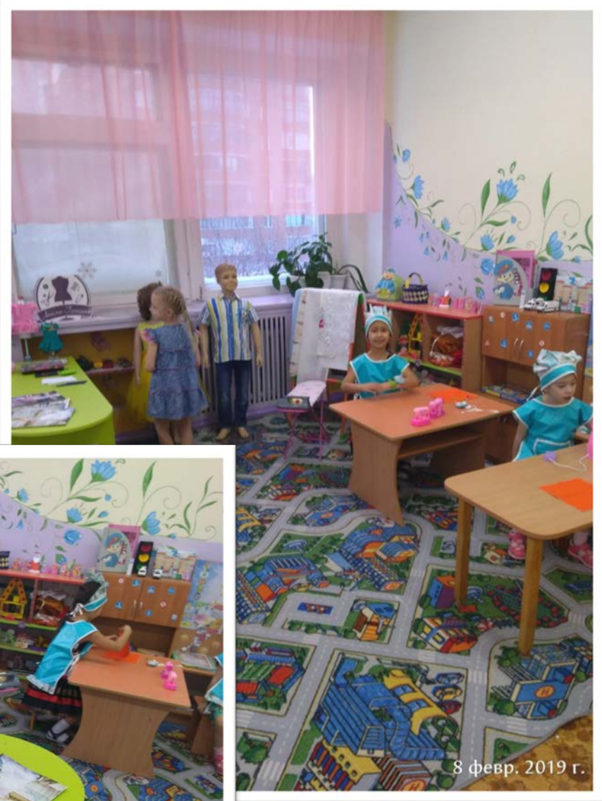
8 февр. 2019 г.